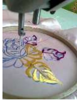
صورة (6) توضح التطريز الآلي

أمثلة لبعض أنواع الغرز التي تطرز آلياً بدون طارة التطريز: غرزة القطان، غرزة السلسلة، الأجر، الزجاج. (30)