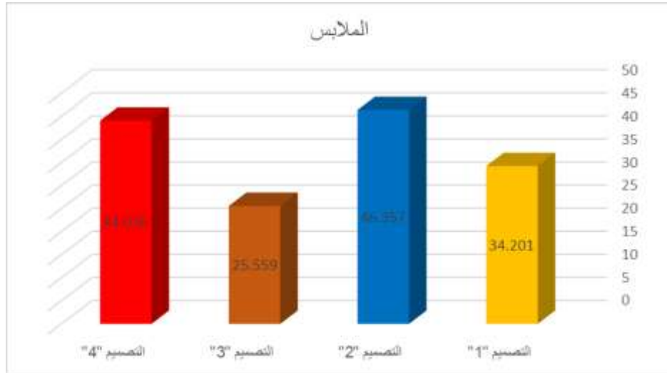
شكل ( 4 ) يوضح متوسط درجات التصميّات الأربعة المقترحة للملابس وفقاً لأراء المستهلكات