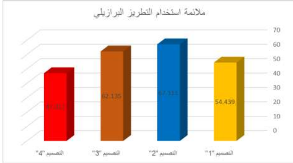
شكل ( 2 ) يوضح متوسط درجات التصميمات الأربعة المقترحة للملابس

في ملائمة استخدام التطريز البرازيلي وفقا لأراء المتخصصين