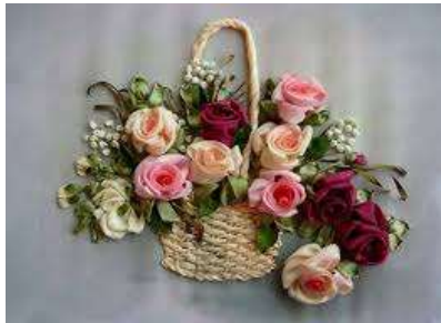
صورة (6) توضح التطريز بشرائط الستان

وهو أسلوب شيق بديع لفن التطريز يظهر فيه فن التوليف حيث يتم تنفيذ شرائط الستان على النسيج بغرز معينة ويظهر بالقطعة إيقاع وتجسيم نتج من ارتفاع ملمس الشرائط المطرزة بها عن مستوى الارضية وبها تنوع فى الملامس والالوان مما يعطى انسجام ووحدة عضوية وإحساس جديد ومختلف عن التوليف بالتطريز بالاساليب التقليدية . (4)