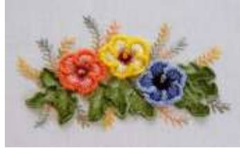
صورة (2) توضح التطريز البارز

ويقصد بالتطريز البارز أن يصبح الشكل النهائى للتصميم المطلوب تطريزه بارزا عن سطح الأرضية عن طريق استخدام أنواع من الخيوط السميكه والغرز التى تساعد على إعطاء البروز المطلوب (22)