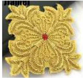
صورة (3) توضح التطريز الأسلاك

وهذه الاسلاك المعدنية ( ذهبية أو فضية ) عبارة عن خيوط تلف حلزونيا على شكل السوسته الرقيقة وتكون على هيئة أسلاك طولية يتم تقطعها الى أجزاء تتناسب مع الشكل الزخرفى المراد تطريزه ويتم تثبيتها عن طريق لضمها فى الابرة بخيوط من نفس لون الارضية (22)