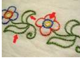
صورة (1) توضح التطريز المسطح