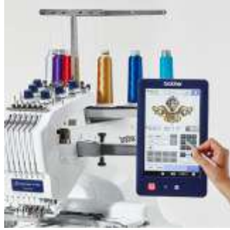
صورة (7) توضح التطريز الإلكتروني