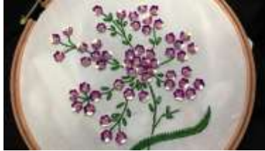
صورة (5) توضح التطريز الترتير

- الترتير : هو عبارة عن دوائر صغيرة أو أوراق أشجار مصنوعة من صفائح معدنية رقيقة أو بلاستيك شفاف ويكون الترتير ذهبيا وفضيا أو ملونا بألوان براقية متدرجة أو بألوان مضيئة غير لامعة . (29)