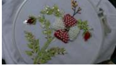
صورة (4) توضح التطريز الخرز

- الترتير : هو عبارة عن دوائر صغيرة أو أوراق أشجار مصنوعة من صفائح معدنية رقيقة أو بلاستيك شفاف ويكون الترتير ذهبيا وفضيا أو ملونا بألوان براقية متدرجة أو بألوان مضيئة غير لامعة . (29)