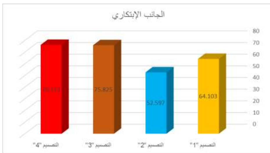
شكل ( 1 ) يوضح متوسط درجات التصميمات الأربعة المقترحة

للملابس في تحقيق الجانب الإبتكاري وفقا لأراء المتخصصين من الجدول ( 11 ) والشكل ( 1 ) يتضح أن :